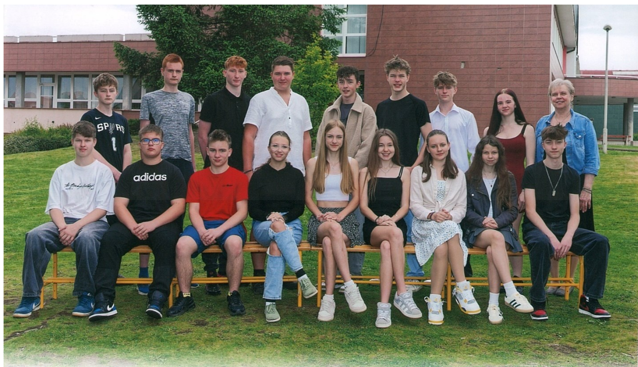
Obrázek 6: Vycházející žáci z IX.B