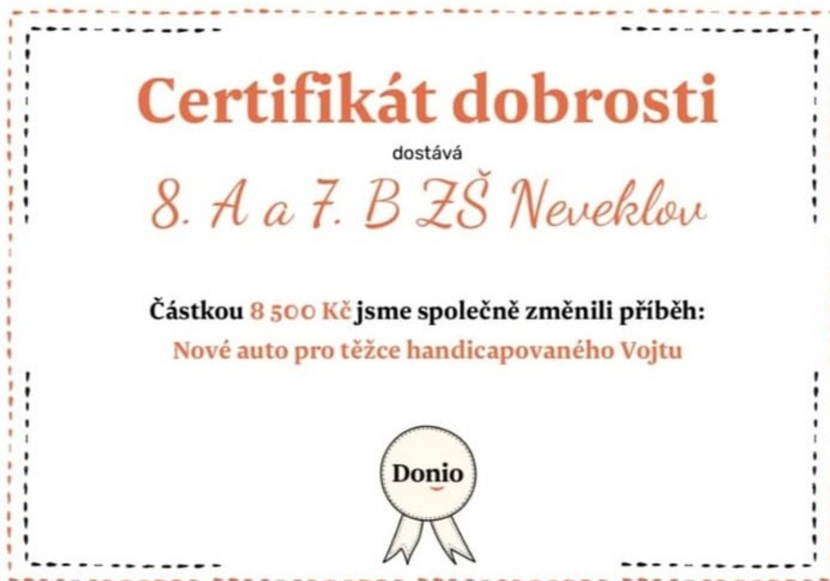
Obrázek 12: Díky akci Bufet pro dobrou věc žáci VIII.A a VII.B podpořili našeho bývalého žáka