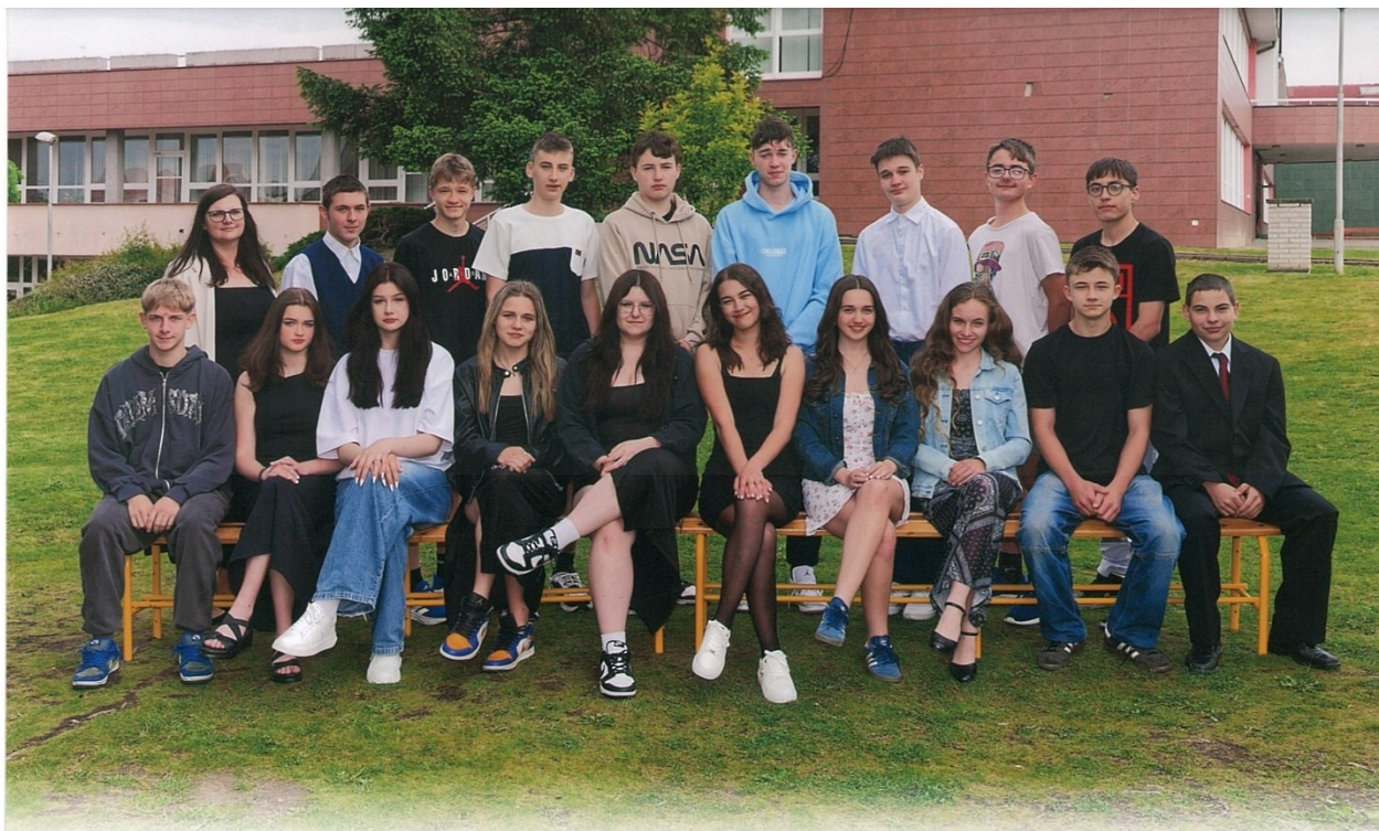
Obrázek 5: Vycházející žáci z IX.A