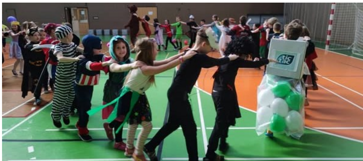
Obrázek 13: Karnevalovou diskotéku pořádala pro mladší žáky IX.B

Během školního roku se vyskytlo několik přestupků proti školnímu řádu. Byly evidovány následující projevy rizikového chování: vztahové problémy mezi žáky, slovní útoky, vulgární vyjadřování, rasistické a xenofobní útoky, užívání tabákových výrobků, záškoláctví a skryté záškoláctví. Všechny situace řešili třídní učitelé ve spolupráci se školským poradenským pracovištěm.