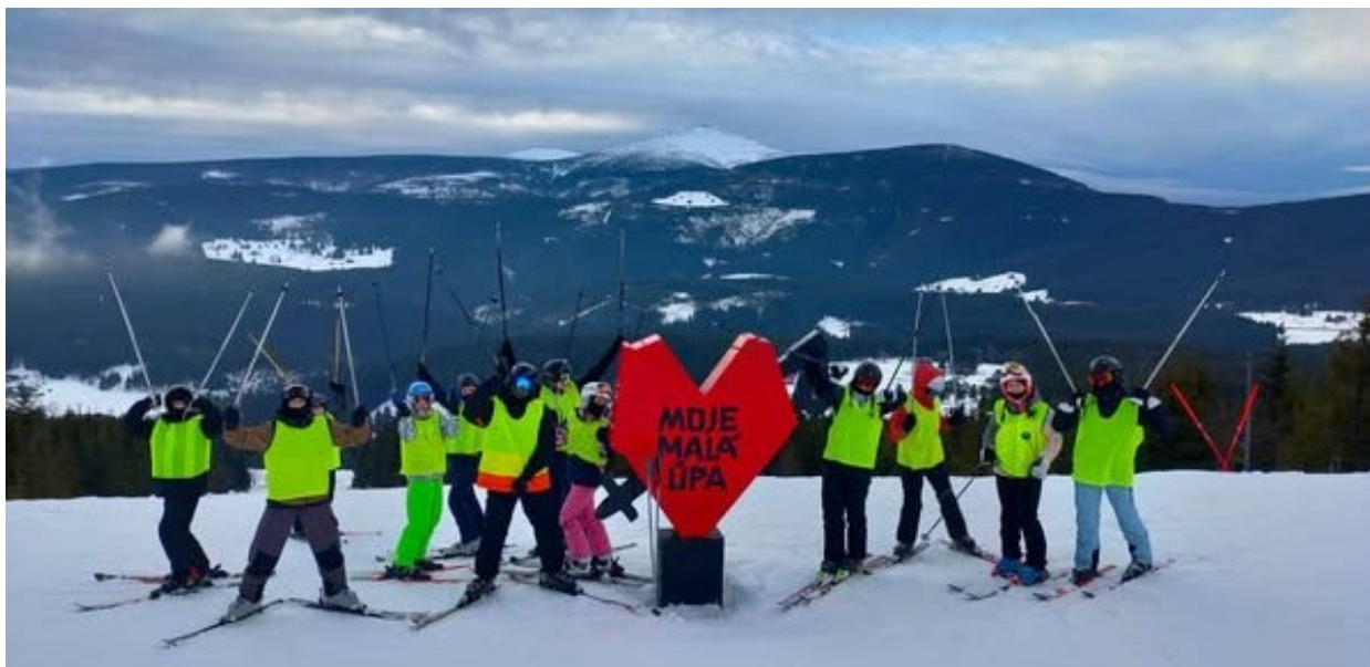
Obrázek 23: Pozdrav z lyžařského výcviku