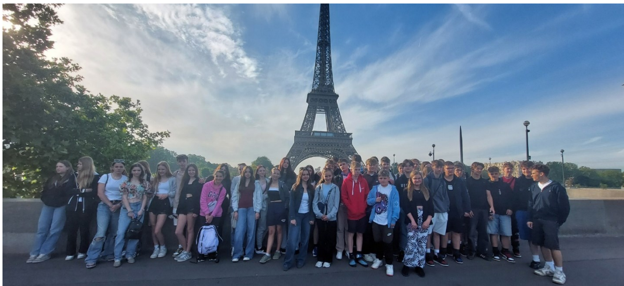
Obrázek 26: 9. ročník v Paříži

V tomto školním roce jsme se více zapojili i do hudebního vzdělání. Žáci se zúčastnili několika koncertů v pražském Rudolfinu. Osmáci si poslechli edukativní koncert Dvořákova 8. symfonie. Pro sedmáky byl připraven program s tématem ročních období. Zaznělo tam nejen Vivaldiho Čtvero ročních období, ale i další skladby. Další byl program Marta v říši hudebních divů pro třetáky a na poslední koncert České filharmonie se vypravili žáci z 5. ročníku. Pro všechny žáky pak byly zorganizovány další koncerty. Hudební skupina Brassfive si připravila vystoupení s názvem V lesku žesťových nástrojů, při kterém seznámila žáky s historií hudby. Vánoční koncert se pak odehrál pod taktovkou skupiny Spojení.