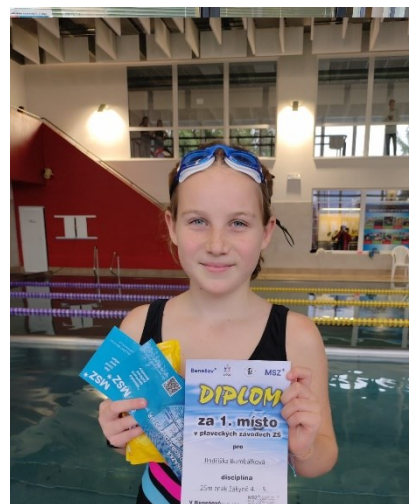
Obrázek 21: Z okresního přeboru v plavání

Žáci 2. stupně se vydali na třídní sportovně-turistické výlety, během kterých absolvovali různé sportovní aktivity – lanové centrum, jízdu na kole či koloběžkách, zorbfoťbal, lezeckou dráhu, adventure golf, skákání na trampolínách či rafting. VI.A se vydala poznávat Prachovské skály, VI.B Posázaví, sedmáci Hradec Králové, osmáci Hlubokou nad Vltavou, IX.A Jičín a Prachovské skály, IX.B Plzeň a IX.C Český Krumlov.