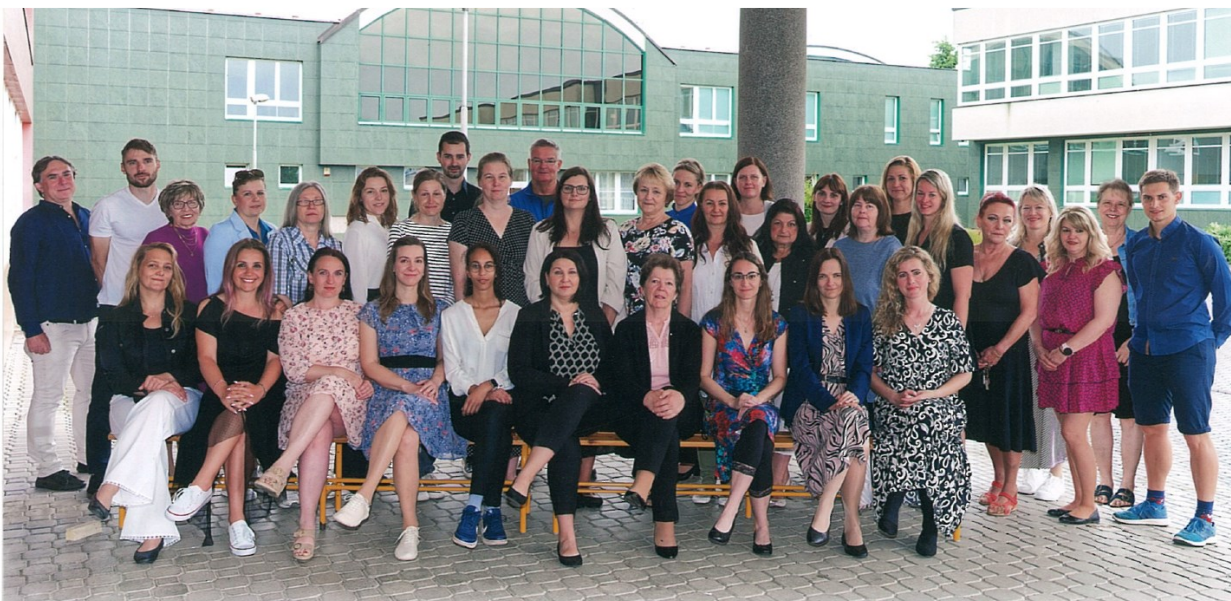
Obrázek 2: Pedagogický sbor školy