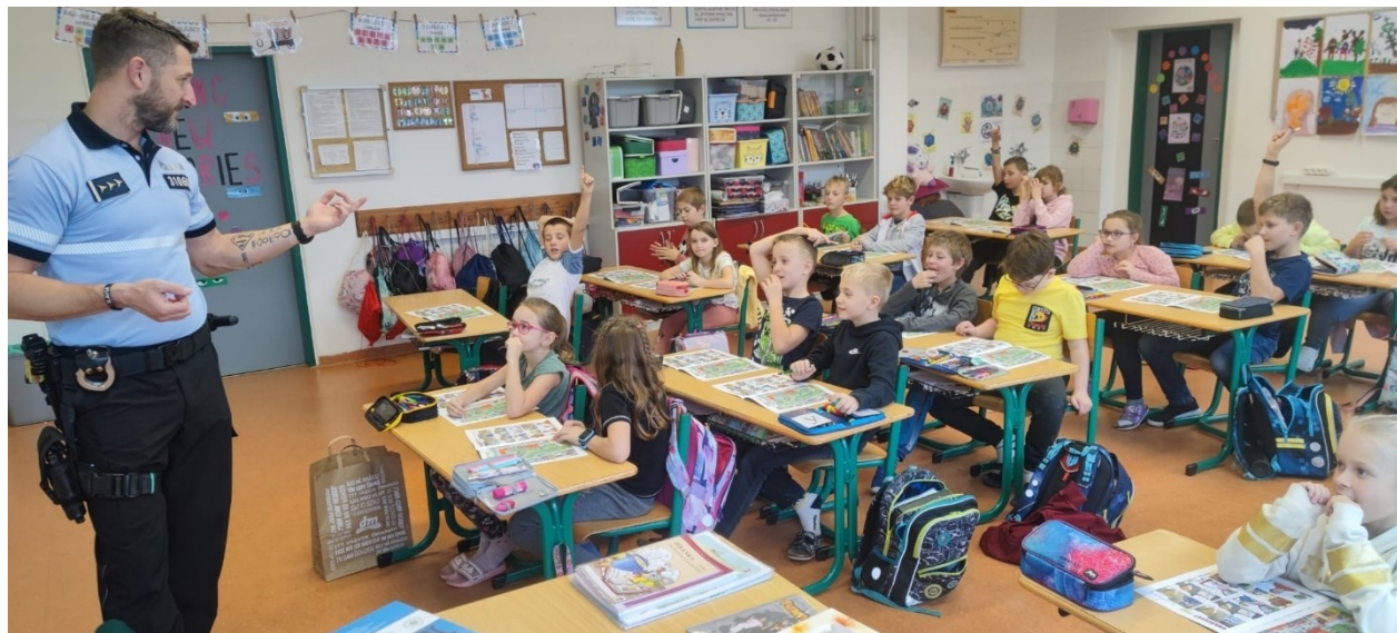
Obrázek 10: Na preventivních aktivitách spolupracujeme i s Policí ČR

Školní žakovský parlament se během roku scházel téměř každý pátek. Řešil různá témata, např. pořízení školních dresů (vytvořen návrh, předán vedení), hřiště za školou (sepsán dopis s požadavky, předán MÚ Neveklov), akce Starší učí mladší (více než 100 dětí z 2.stupně šlo učit své mladší spolužáky), pro MŠ Maršovice a Neveklov připravil stezku s úkoly v naší škole. V říjnu také se 3 členy vyjel na setkání školních parlamentů do Benešova (pořádalo Posázaví o.p.s.). Odměnou členům žakovského parlamentu za celoroční práci pak byl výlet na lasergame.