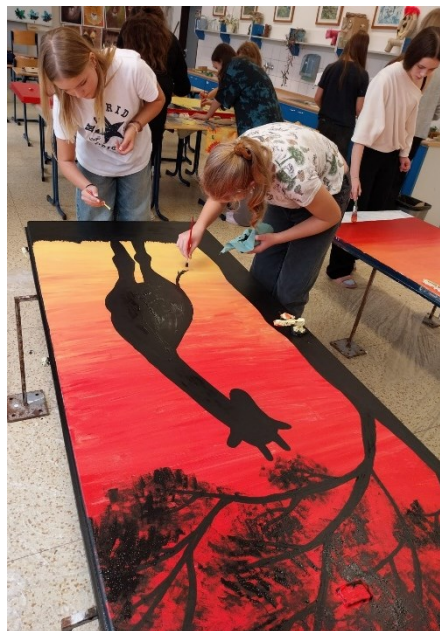
Obrázek 11: Malování dveří