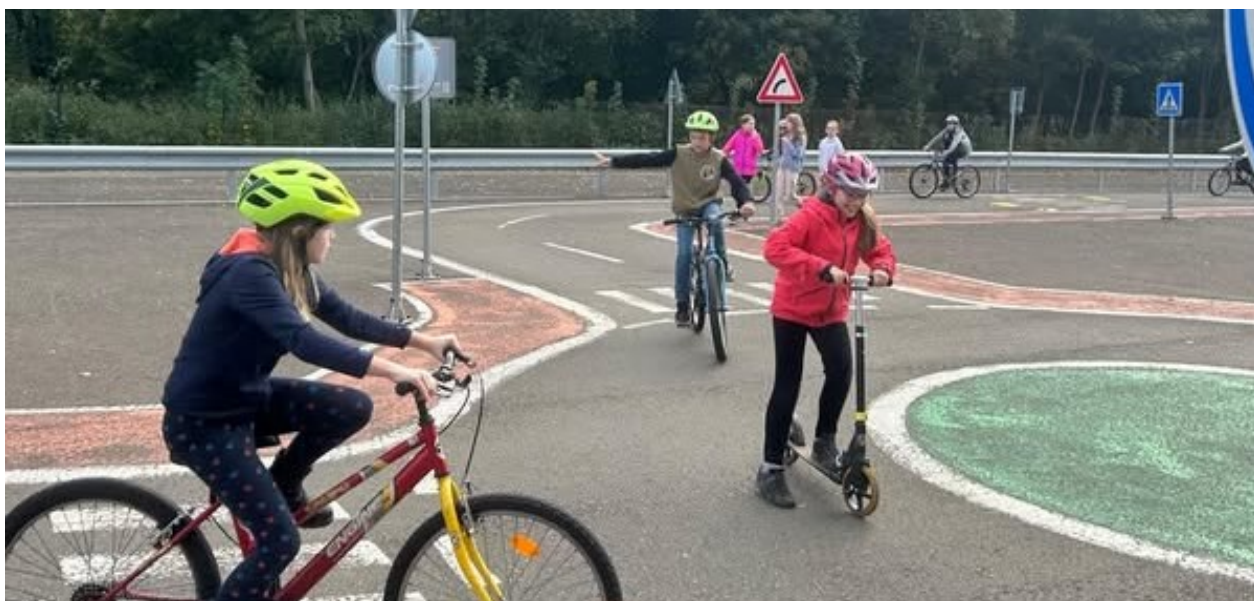
Obrázek 28: Na dopravním hřišti v Benešově

Improvizované dopravní hřiště vzniklo i před budovou školy. V menším měřítku si tak i ostatní žáci a účastníci školní družiny zopakovali význam dopravních značek a základní pravidla pohybu na silnici.