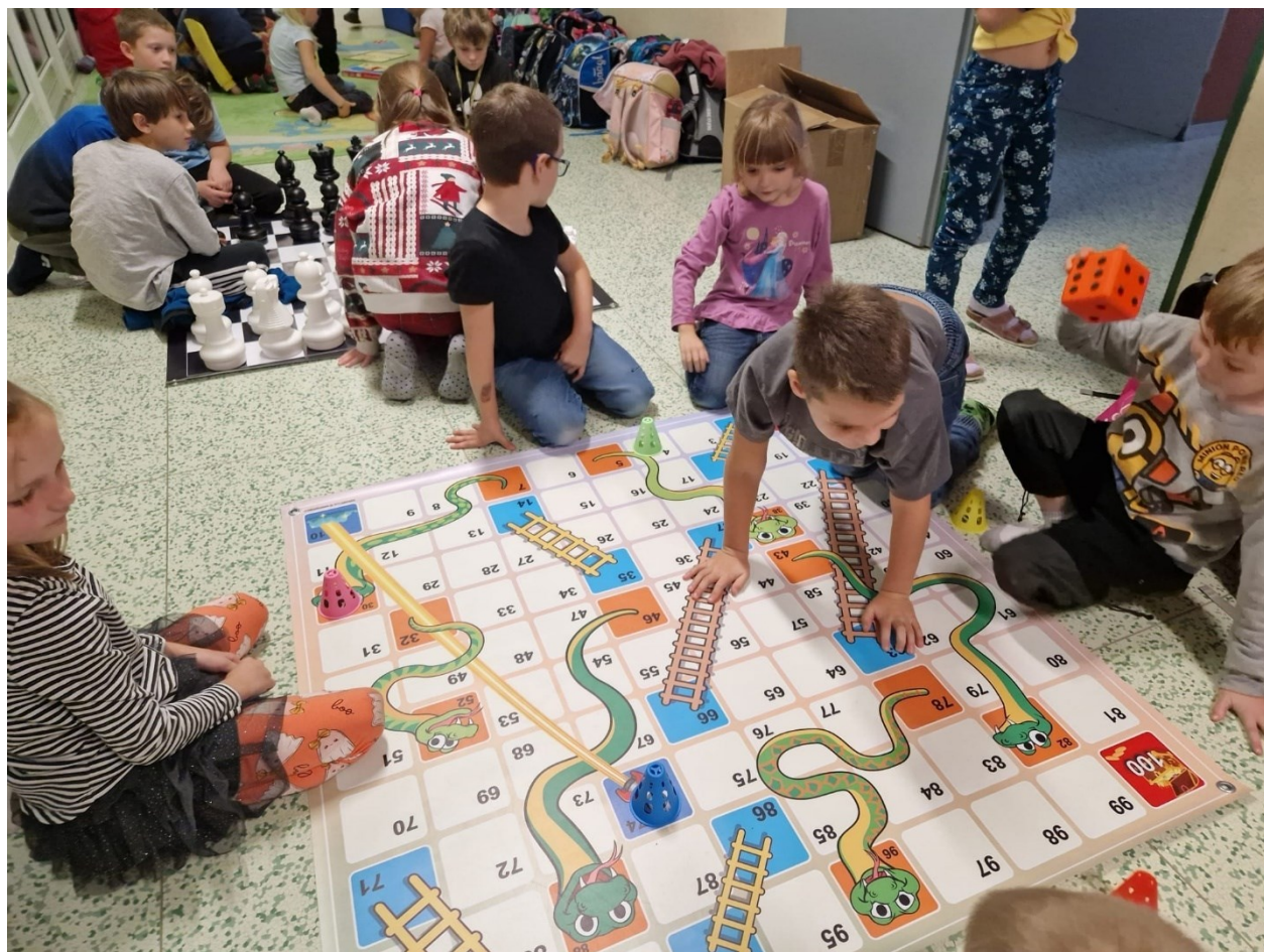
Obrázek 10: Deskovky nejsou retro

Hry si připomněly i v rámci projektového dne Deskovky nejsou retro. Užily si tak den s velkoformátovými přenosnými podložkami různých společenských her (např. šachy, dáma, mlýn, ...) a s dalšími oblíbenými deskovkami.