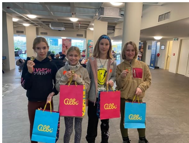
Obrázek 15 a 16: Reprezentanti školy v PišQworkách a Ubongu