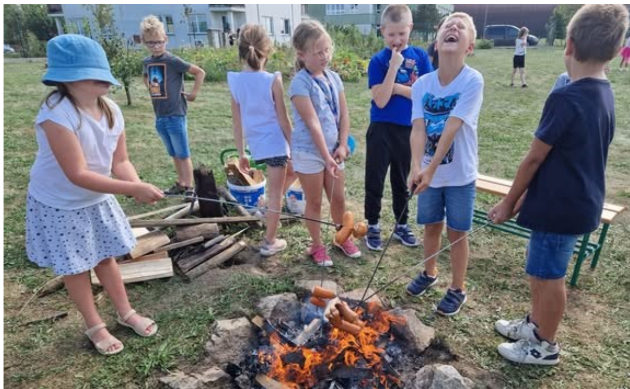
Obrázek 29: Na školní zahradě

První společnou akcí bylo uvítání dětí po prázdninách. Školní družina se tak přesunula na zahradu, kde si každý mohl na ohni opéct špekáček, společně si zazpívat a zahrát různé kolektivní hry.