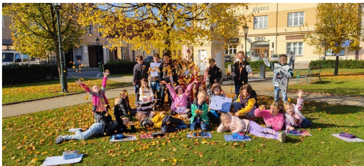
Obrázek 1: III. B se učila venku

Učebnice a další pomůcky k výuce se pořizují průběžně dle potřeb jednotlivých předmětových komisí. Dochází k jejich pravidelné obměně. Všechny pořizované pomůcky jsou v souladu s aktuálním RVP.