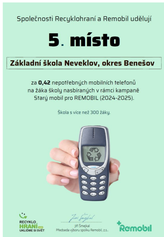
Obrázek 18 a 19: Ocenění za účast v Recyklohraní.

Žáci IX.B pořádali sbírku na pomoc útlukům pro opuštěná zvířata. Zvířátka navštívila i žáci III.B v rámci felinoterapie a canisterapie. V rámci školních výletů pak třídy poznávaly zvířata i v zoologických zahradách (např. 2. ročník a I.A v ZOO Ohrada v Hluboké nad Vltavou a 7. ročník v ZOO Praha).