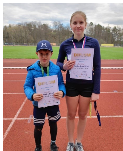
Obrázek 22: Z plavecko-štafetového závodu