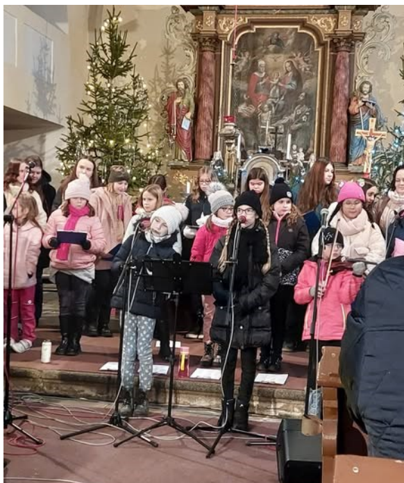
Obrázek 27: Pěvecký sbor zazpíval v rámci projektu Oživé kostely

V tomto školním roce jsme se více zapojili i do hudebního vzdělání. Žáci se zúčastnili několika koncertů v pražském Rudolfinu. Osmáci si poslechli edukativní koncert Dvořákova 8. symfonie. Pro sedmáky byl připraven program s tématem ročních období. Zaznělo tam nejen Vivaldiho Čtvero ročních období, ale i další skladby. Další byl program Marta v říši hudebních divů pro třetáky a na poslední koncert České filharmonie se vypravili žáci z 5. ročníku. Pro všechny žáky pak byly zorganizovány další koncerty. Hudební skupina Brassfive si připravila vystoupení s názvem V lesku žesťových nástrojů, při kterém seznámila žáky s historií hudby. Vánoční koncert se pak odehrál pod taktovkou skupiny Spojení.