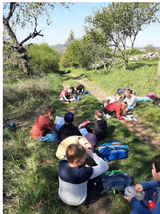
Obrázek 17: III.A se učí venku

Opět jsme se zapojili do projektu Recyklohraní. Sbírali jsme staré baterie, malé elektrospotřebiče, tonery či rozbité mobilní telefony. Zároveň jsme plnili různé úkoly a účastnili jsme se celoroční hry. Z téměř 400 zapojených škol jsme skončili na 128. místě (15. ve Středočeském kraji).