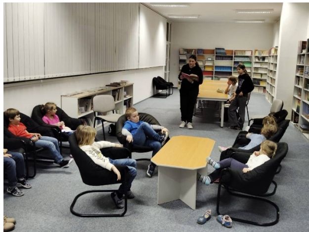
Obrázek 3 a 4: Akce připravená školním žakovským parlamentem pro děti z mateřské školy