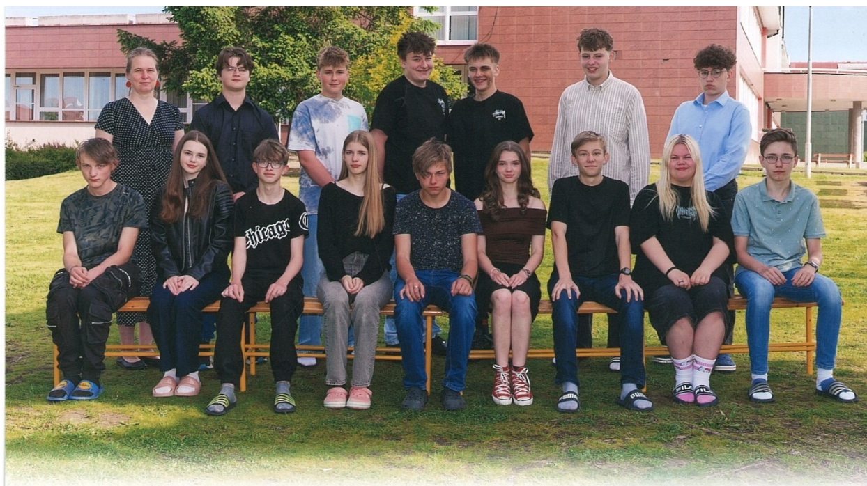
Obrázek 7: Vycházející žáci z IX.C