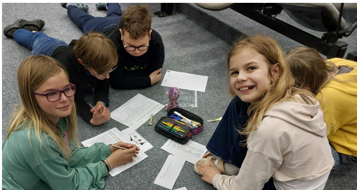
Obrázek 9: V.A a práce ve skupině

K 30. červnu 2025 bylo na škole celkem 14 žáků s odlišným mateřským jazykem, z toho 10 z Ukrajiny, 2 z USA a 2 z Vietnamu. Pro tyto žáky bylo připraveno doučování českého jazyka (financované v rámci projektu OP JAK Šablony pro ZŠ a MŠ I.).