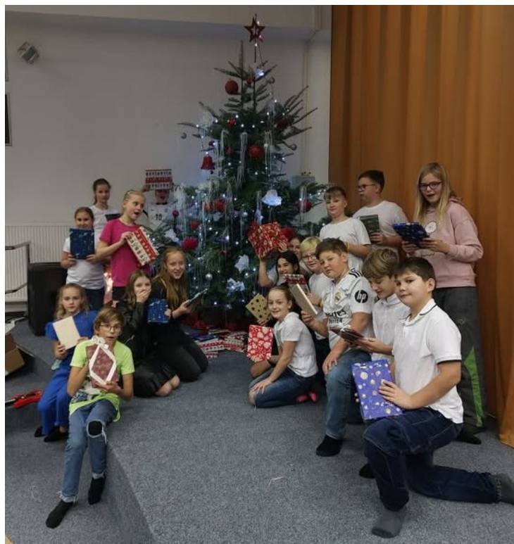
Obrázek 14: Rozbalení dárků od SRPŠ v rámci akce Strom knižních přání

V rámci výuky všech předmětů jsme motivovali žáky k rozvoji čtenářské gramotnosti. Čtení a pochopení čteného textu bylo rozvíjeno během výuky i díky různým akcím, soutěžím a projektům. Vznikly čtenářské koutky v jednotlivých třídách, nadále jsme spolupracovali v rámci